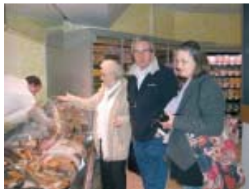
Kunden am Stand der neuen Fischabteilung warten geduldig bis sie dran sind.

In Kürze wird es auch Rezepte und Weinempfehlungen zu einigen Fischarten geben. Diese werden dann über die neuen Wa-