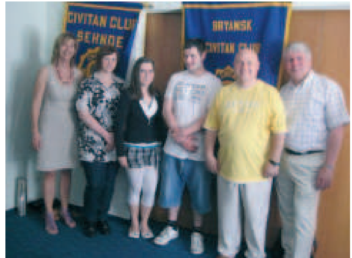
Der Nachmittag mit den Brjansker Gästen klang mit einem Rundgang durch die Altstadt von Hannover und dem gemeinsamen Public Viewing beim Fußballspiel Deutschland – England aus.