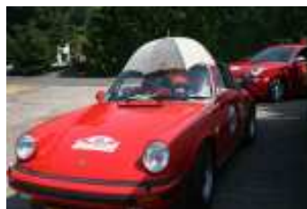
Bei herrlichem Sonnenschein gut behütet.

Übrigens bekommt Sehndes Oldtimerszene Zuwachs. Auf dem Gelände der Plate Dienstleistungs-